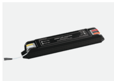
WIFI Контролер 2,4G для трекових систем MERALLI вбудований