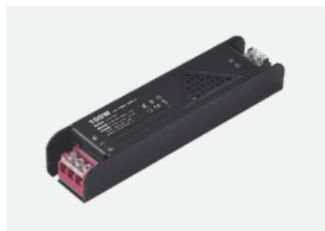
Трансформатор для трекових систем вбудований MERALLI 24V