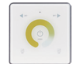
Сенсорний блок керування WIFI 2,4G