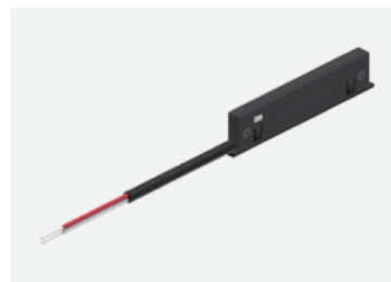
Блок живлення для магнітних шинопроводів 24V MERALLI